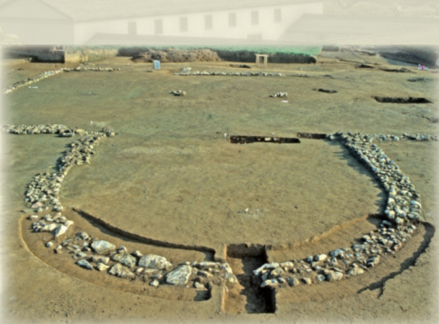
ANTIKE GRUNDMAUERN DES FORUMS

SEIT 1993 WIRD IN LAHNAU-WALDGIRMES (LAHN-DILL-KREIS) DIE ÄLTESTE RÖMISCHE STADTGRÜNDUNG ÖSTLICH DES RHEINS ERFORSCHT. DIE ETWA 7,7 HA GROSSE MIT EINER HOLZ-ERDEMAUER UND ZWEI VORGELAGERTEN SPITZGRÄBEN BEFESTIGTE ANLAGE WURDE SPÄTESTENS IM JAHR 3 V.CHR. GEGRÜNDET UND VERMUTLICH NACH DER NIEDERLAGE DES RÖMISCHEN STADTHALTERS VARUS 9 N.CHR. AUFGEGBEN.