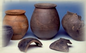
RÖMISCHE UND GERMANISCHE KERAMIK